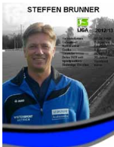
SV Unterweissach 1930 e.V.